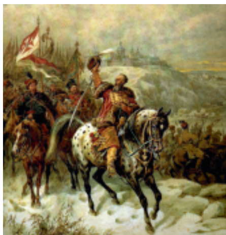
Juliusz Kossak Czarniecki pod Płockiem, XIX w.

W 1652 r. otrzymał urzędy oboźnego wielkiego koronnego oraz kasztelana kijowskiego zyskując tym samym godność senatora. Kolejno brał udział w oczyszczaniu fortec i osad w województwie braclawskim z załóg kozackich, gdzie został ciężko ranny w podniebienie. Podczas wojny polsko-szwedzkiej zwanej "potopem" (1655-1660), w pierwszej jej fazie, dowodził obroną Krakowa i został ponownie ciężko ranny w twarz. Następnie udał się do Głogówka, gdzie schronił się król Jan Kazimierz. Namówił władcę do powrotu ze Śląska i ogłoszenia wojny wszystkim stanów z najeżdźcą. W 1656 r. objął dowództwo niezależnej dywizji oraz godność regimentarza. Na tych stanowiskach odbił Sandomierz oraz prowadził tzw. wojnę szarpaną (działania partyzanckie polegające na ciągłym nękaniu sił wroga bez przyjmowania walnej bitwy). Walczył w Wielkopolsce, Prusach i pod Warszawą. W 1657 r. pod Czarnym Ostrowem zmusił wspierające Szwedów wojska