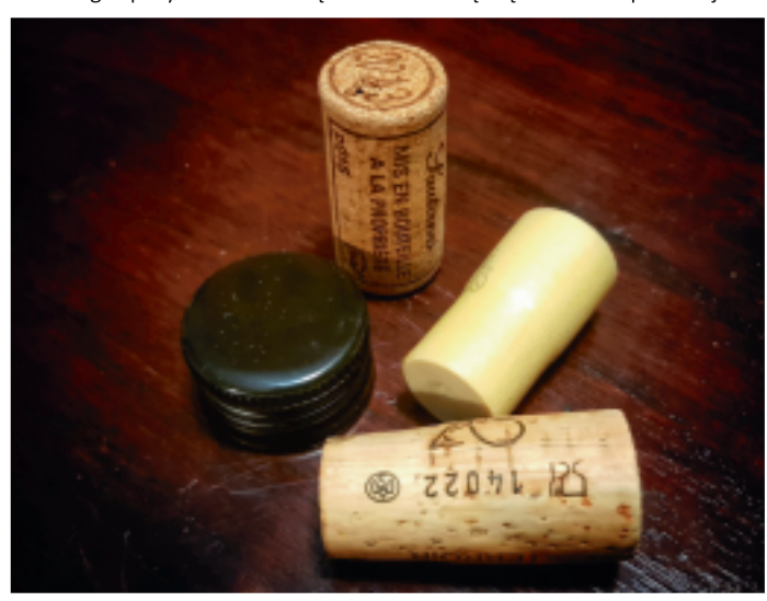
różne sposoby zamknięcia wina na różne okazje

Dokładnie, a kolejne można powtarzać co 10-12 lat. Ponieważ liczba dębów korkowych jest ograniczona, a wino staje się coraz popularniejszym trunkiem i jego amatorów przybywa w szybkim tempie, stało się oczywiste, że jego koszt wzrósł. W pewnym momencie w przypadku win do codziennego spożycia korek zaczął stanowić dużą część kosztów produkcji.