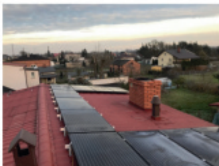
INSTALACJE FOTOWOLTAICZNE - NASZE REALIZACJE