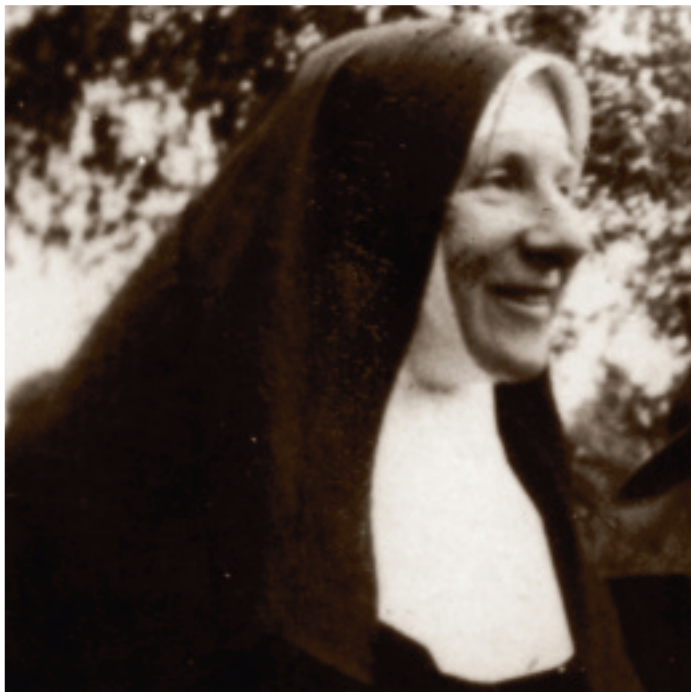
"Miłość delikatna i wrażliwa na cierpienia bliźnich." (Matka Czacka)

Te słowa dobrze oddają ducha życia i działalności Róży Czackiej, bł. Matki Elżbiety, kobiety, która z osobistego doświadczenia uczyniła drogę służby innym. Jej życie to historia niezwykłej odwagi, wiary oraz konsekwencji w działaniu. Dzięki niej powstał w Polsce nowoczesny system edukacji i pomocy osobom niewidomym, dając nadzieję tysiącom ludzi na godne życie.