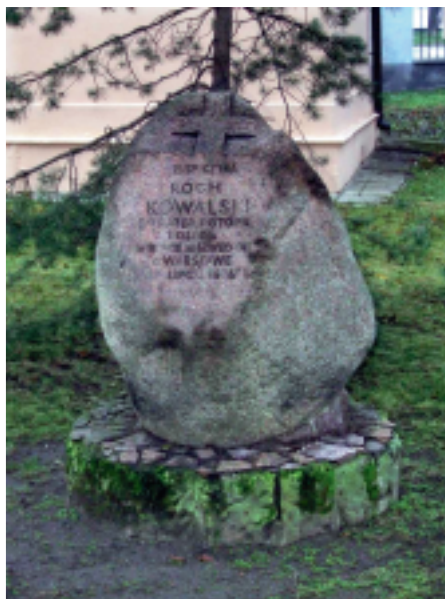
symboliczny grób Rocha Kowalskiego przy kościele Matki Boskiej Loretańskiej na Pradze

W jego przebraniu sprowadził chorągiew Wołodyjowskiego i odbił konwojowanych oficerów. Następnie Zagłoba przeciągnął Kowalskiego na swoją stronę. Nienawidzący Szwedzkiego króla Roch postanowił, przy nadarżającej się okazji, zabić Karola Gustawa. Próbę podejmuje dwukrotnie. Za pierwszym razem, szwedzki król uciekając powalił go na ziemię, strzelając w nogi konia, na którym cwałował Kowalski. Podczas bitwy warszawskiej przyspuższa szaleńcy atak na szwedzkiego króla i ginie zastrzelony przez księcia Bogusława.