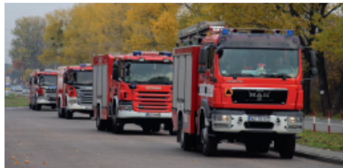
z Ochotniczych Straży Pożarnej, w tym z Izabelina i Lasek.

W ćwiczeniach oprócz zastępów PSP z Warszawy, Błonia, Pruszkowa i Nowego Dworu Maz. brały udział również najbliższe zlokalizowane zastępy