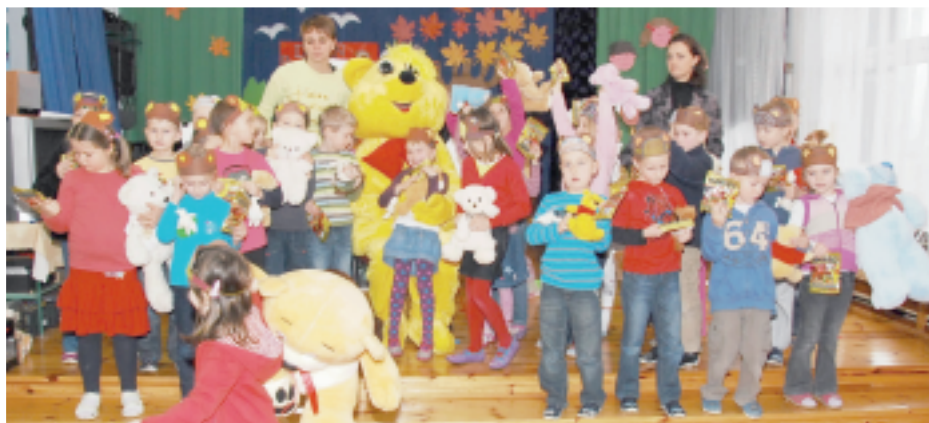
każde dziecko przyniosło ze sobą swojego ukochanego misia