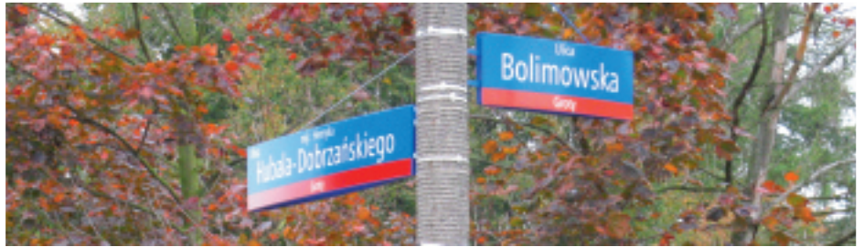
Nazewnictwo nie może wprowadzać chaosu. Podobnie jak w Stolicy (powyżej wzór oznakowania), nazwy ulic nie mogą być powtórzeniem już istniejących.

Podjęto jednak kilka decyzji łamiących zasady trwania przy tradycji. W Starych Babicach ulica zwana przez mieszkańców Zastodolną stała się ulicą Wołodjowskiego (no cóż, może niektórzy nie chcieli mieszkać „za stodołami” w czasach, kiedy tych stodoł już nie było), natomiast Folwarczna w części została przemianowana na Warszawską (to rozumiałe), w części zaś biegnącej bezpośrednio przy dawnym majątku, na Piłsud-